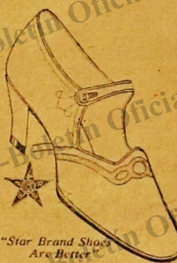
"Star Brand Shoes Are Better"