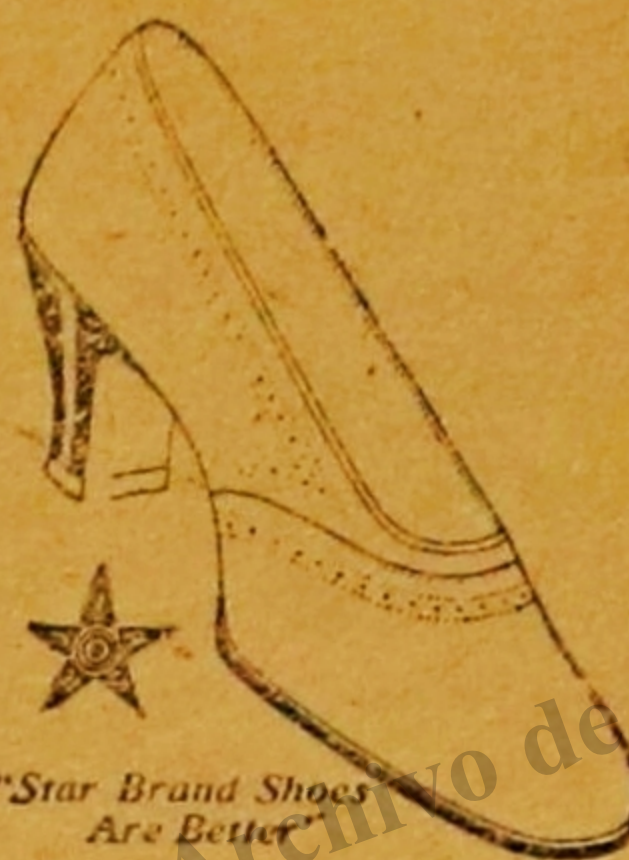
"Star Brand Shoes Are Better"