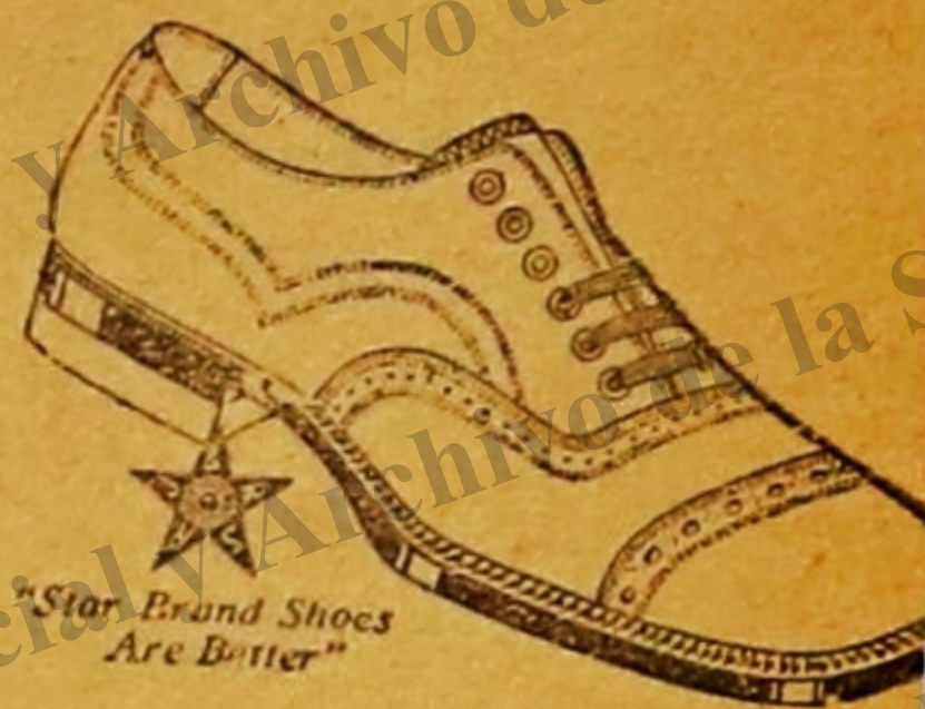
"Star Brand Shoes Are Better"