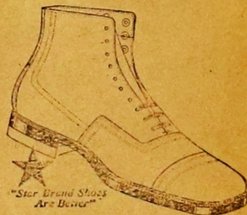
"Star Brand Shoes Are Better"