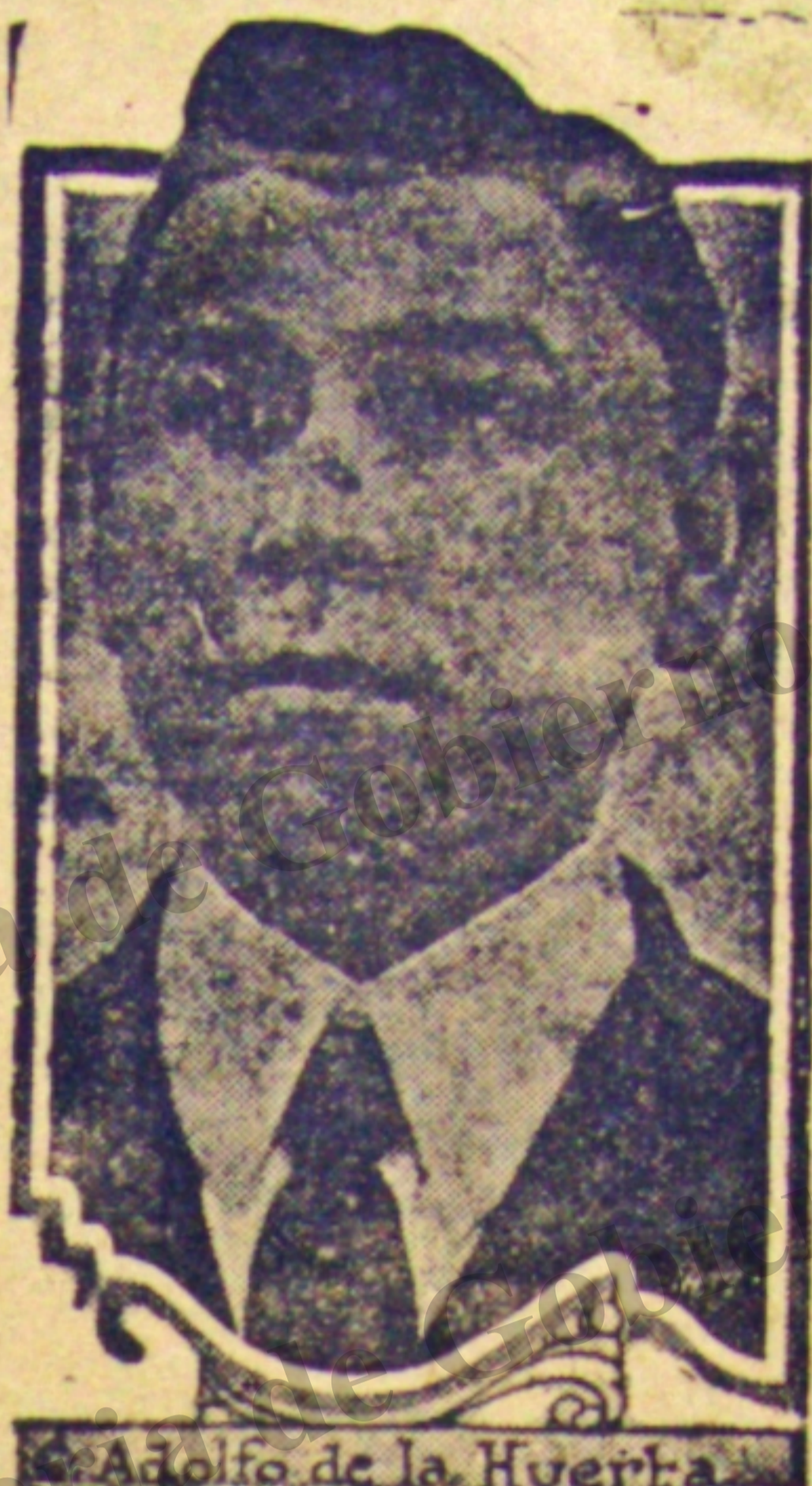
Que ha sido desconocido como Jefe Supremo de la Rebelión

En la Jefatura de Operaciones se nos proporcionó este otro mensaje del primer Magistrado de la Nación.